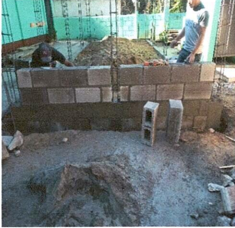
Foto1: Mejoramiento de aula levantado de 3 hiladas, ventanas y puerta.