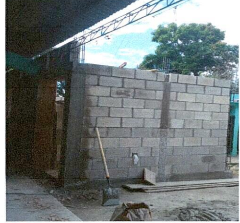
Foto1: Fundición de columnas 3 hiladas y Mejoramiento techo.